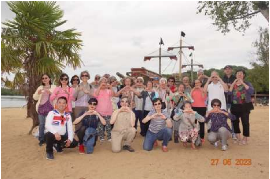
在湖邊同唱詩歌，輕訴對主耶穌的愛慕

中心在 6 月 27 日舉辦了夏季郊遊，我們乘坐公共交通工具，經過 1 小時多便從中心到達目的地。Ruislip Lido 位於西北倫敦，佔地 60 英畝，是一個水塘並有人工沙灘。天父的供應超過我們的所想所求。感謝神應允禱告，賜下合宜天氣，攝氏 20 度，陽光和暖，微風伴隨。我們一行 30 人，由 20 出頭到 90 後 (90 歲以上) 也投入參與。我們在沙灘唱詩讚美，集體遊戲及野餐，又沿著湖邊步行徑漫步繞湖一周，享受天父創造的大自然。還有細心兼有心的弟兄姊妹，預備各種食物和飲用水跟大家分享。整天行程中雖有未臻完美的地方，幸得各位原諒包容。特別要多謝各路英雄在各個集合點痴痴地等。你們耐心等待，促成大家可以充滿愛心，彼此照應，一起同行！