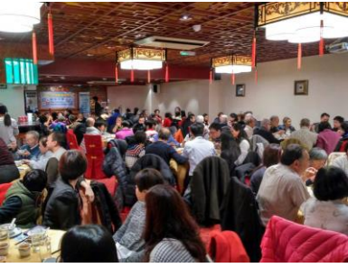
二十週年聚餐 嘉賓濟濟一堂