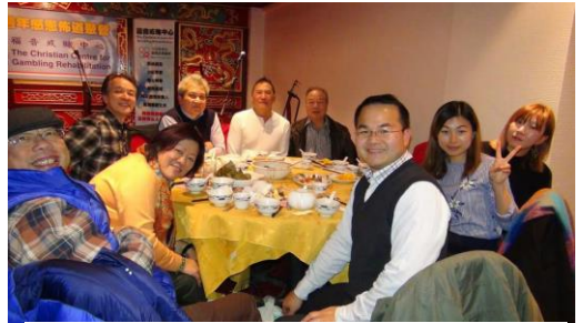
牛津餐福樂團、短片隊員及好友